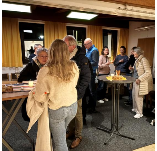
Ökumenischer Segnungsgottesdienst am 13.02.2026