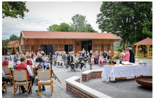
Foto vom Gottesdienst im Grünen in Elbergen 2025