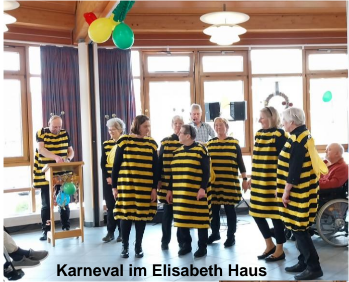
Karneval im Elisabeth Haus