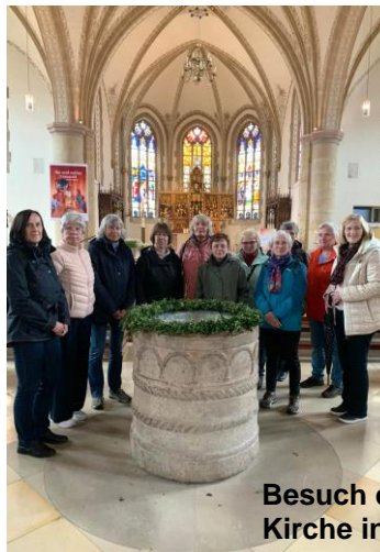
Besuch der St. Andreas Kirche in Emsbüren