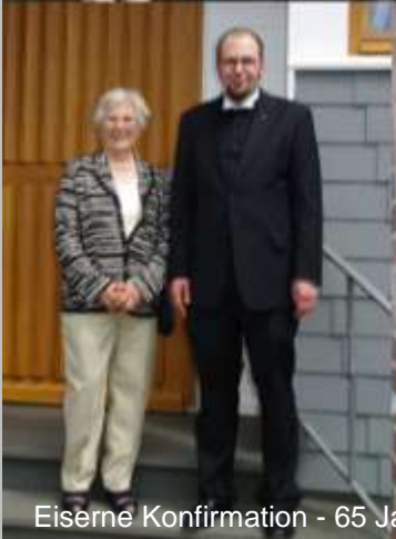
Eisene Konfirmation - 65 Jahre