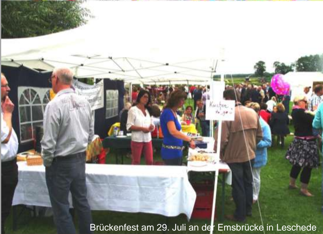
Brückenfest am 29. Juli an der Emsbrücke in Leschede