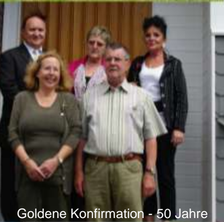
Goldene Konfirmation - 50 Jahre