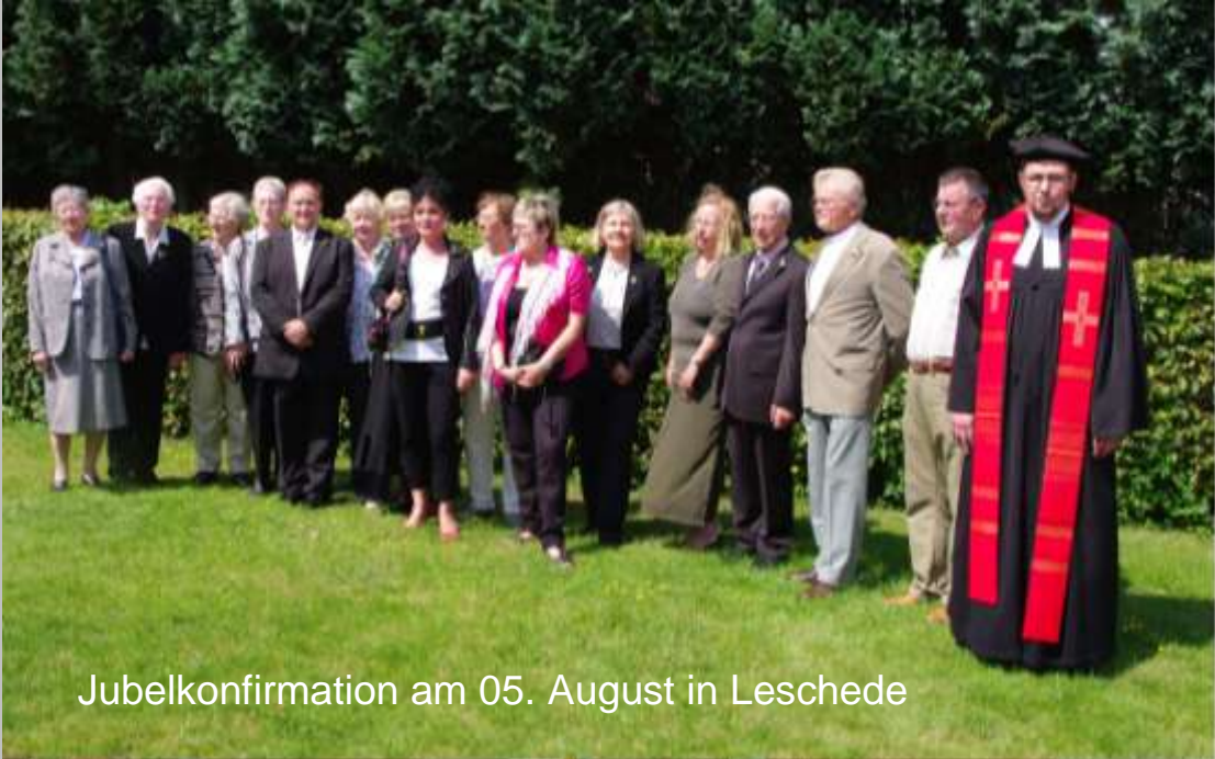
Jubelkonfirmation am 05. August in Leschede