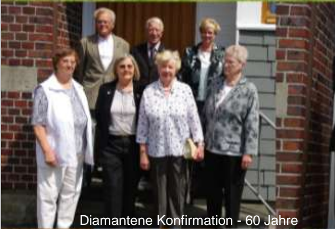
Diamantene Konfirmation - 60 Jahre