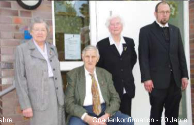
Gnadenkonfirmation - 70 Jahre