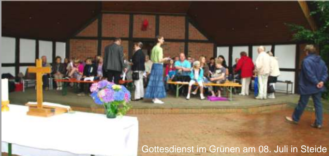
Gottesdienst im Grünen am 08. Juli in Steide