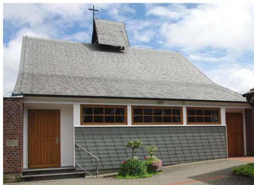
Neue Fenster und Türen in der Erlöserkirche