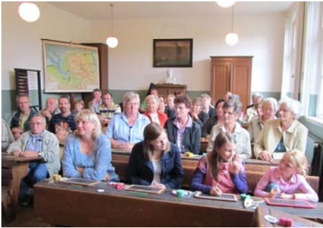
Besuch im Schul- museum in Folmhusen

Allen, die sich mit ihrer Gabe für leidende Menschen in der Nähe und in der Ferne einsetzen oder auch die Arbeit unserer Gemeinde unterstützen, danken wir herzlich.