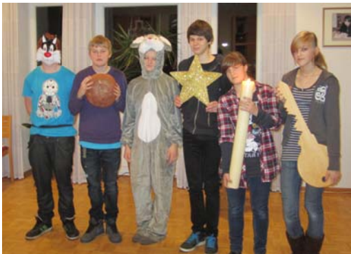
Unsere Konfirmanden - Probe für die Seniorenadventsfeier