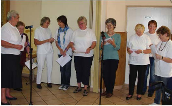
Das Elisabeth-Team als Theatergruppe