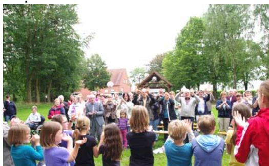
Gottesdienst im Grünen