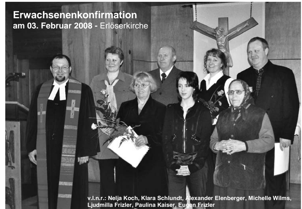
Erwachsenenkonfirmation am 03. Februar 2008 - Erlöserkirche