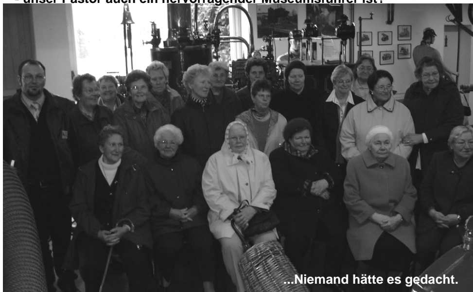
...Niemand hätte es gedacht.