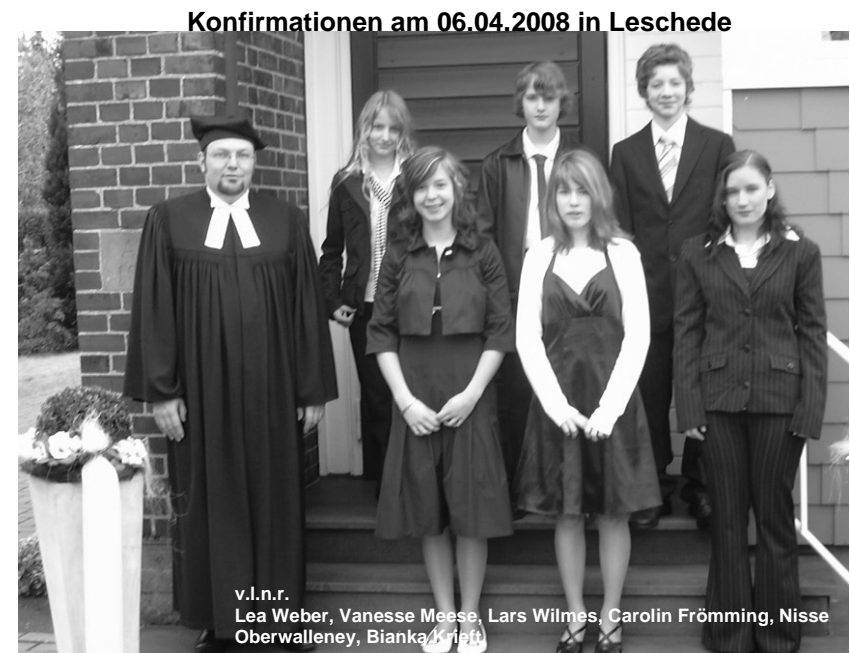
Konfirmationen am 06.04.2008 in Leschede